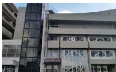
ハピネス福知山(福知山市役所隣り)